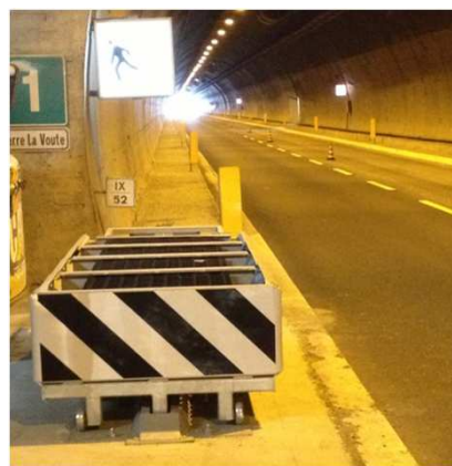
Galleria SLV - Nuova barriera su BP