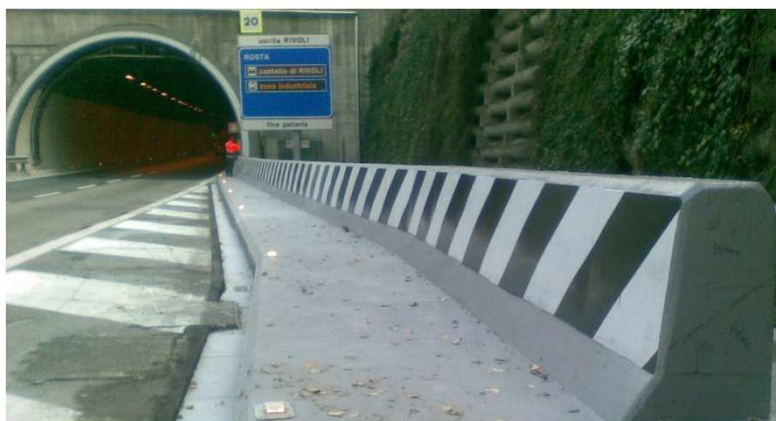
Galleria La Perosa - Nuovo profilo ridirettivo su piazzola