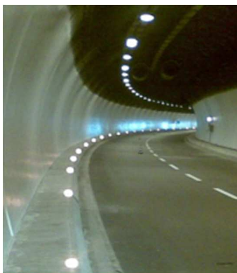
Galleria Prapontin - Nuovo marciapiede con nuovo sistema luminoso LED