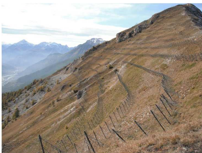
Foto 1 - Vista di insieme sistema paravalanghe