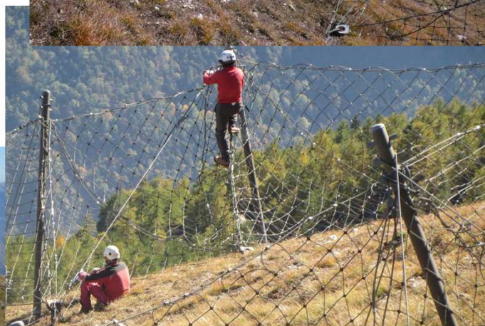
Foto 2-3-4 - Lavori in corso per riposizionamento barriere